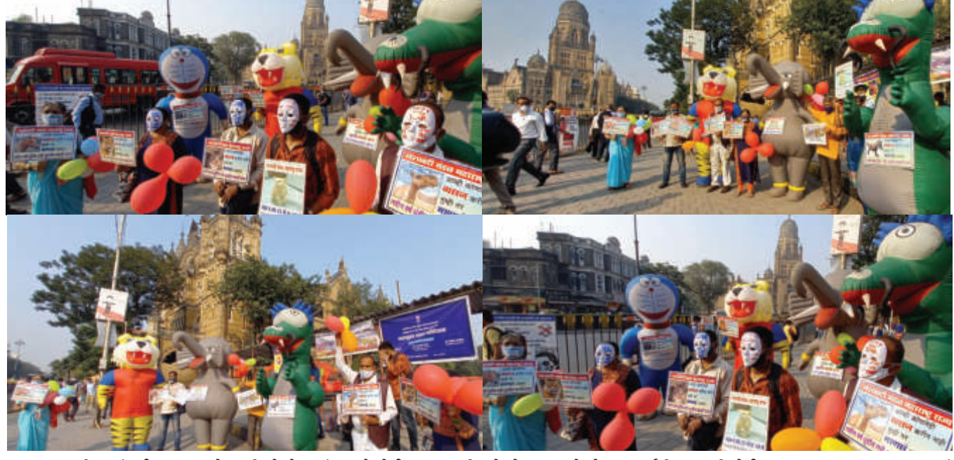
ચક્રવાત ટીમ, મુંબઈ, ૩૦ : અમે પ્રાણીઓ છે છતાં અમને કોઈ વ્યસન નથી તમે તો મનુષ્ય છો તો નવા વર્ષની ઉજવણી કોઈપણ જાતના વ્યસન વગર નશામાં થીત થઈ અને ન કરતાં શુદ્ધ હવામાં કરો તેવા સંદેશો આપતા નશાબંધી મુક્તીમંડળના સભ્યોએ બેનર દર્શાવ્યા હતા.