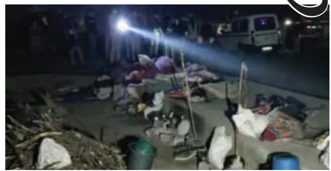
ધરવિહોણા લોકો માટે ચાલતી સરકારની રેનબસેરા યોજના માત્ર કાગળ પર જ

સારવાર આપવામાં આવી રહી છે. બેકાબુ બનેલા ડમ્પરે ચારથી પાંચ દુકાનોના શેડ પછા તોડી નાખ્યાં હતા. ટ્રેક્ટરને ટક્કર માર્યા બાદ ફૂટપાથ પર સૂતેલા શ્રમિકોને કચડ્યા બાદ ડમ્પર ચાલકે ફૂટપાથ ફૂટાવી પાછળની તરફ