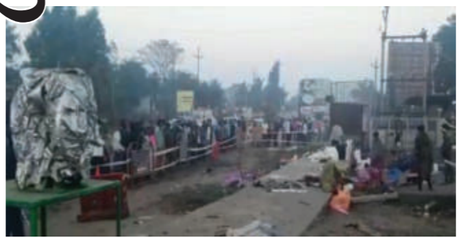
કિમ ચાર રસ્તા પાસે ફૂટપાથ પર મીઠી તિંદ્રા માણી રહેલા શ્રમિકોના ઉંઘમાં ૪ મોત

ઊંઘી રહેલા શ્રમજીવો પર ફરી વળ્યું હતું. પ્રામ વિગતો મુજબ બાંધકામ ક્ષેત્રમાં છૂટક મજૂરી કરતા કેટલાક શ્રમજીવો કિમ-માંડવી રોડ પર રસ્તાની ફૂટપાટ પર રહેતા હતા. રાત્રે ૧૨ વાગ્યા આસપાસ ભર ઊંઘમાં રહેલા મજૂરો પર ડમ્પર કાળ