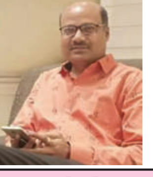
એક ઘા અને બે કટકા જિગર સન્યાસી

સ્થાનિક સ્વરાજના મોડેલથી આપણા બંધારણના ઘડવૈયાઓ સંતુષ્ટ ન હતા. આથી તેઓએ બંધારણિય અનુચ્છેદ ૪૦માં ગ્રામ પંચાયતના ગઠનની વાત કરી રાજ્યોને ગ્રામપંચાયતોનું ગઠન કરવા આદેશ આપેલ છે. પંચાયત રાજનું હાલનું પ્રચલિત અને અસલ સ્વરૂપ બંધારણના ૭૩ અને ૭૪માં સુધારા વધારા ૧૯૯૨માં સ્થાપિત કરવામાં આવેલ છે. ગુજરાતમાં હાલ ત્રિસ્તરિય પંચાયત રાજ અસ્તિત્વ ધરાવે છે જેમાં ગ્રામ પંચાયત, તાલુકા પંચાયત અને જિલ્લા પંચાયતો તેમજ શહેરી કક્ષાએ મહાનગરપાલિકા અને નગરપાલિકાનો સમાવેશ થાય છે. સ્થાનિક સ્વરાજનો મૂળ ઉદ્દેશ