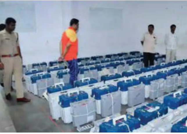
ઈવીએમ મશીન મોકલી દેવામાં આવ્યા છે. ઈવીએમ મશીનને ચેક કરી અને એને યુક્ત પોલીસ-બંદોબસ્ત સાથે વોર્ડના મતદાન મથકો પર મોકલવામાં આવી રહ્યા છે. આજે રાતે યુક્ત

આદમી પાર્ટી, એનસીપી, બીએસપી, જનતા દળ સેક્યુલર, સીપીઆઈ, એઆઈએમઆઈએમ સહિતના પક્ષો અને અપક્ષ ઉમેદવારો ચૂંટણી મેદાનમાં છે. રાજ્યમાં ૨૧ ફેબ્રુઆરીએ મહાનગરપાલિકામાં મતદાન પ્રક્રિયા હાથ ધરાશે, જેમાં કુલ ૧,૧૪ કરોડ મતદારો મત આપવાની ઉપયોગ કરશે. રાજ્યમાં મહાનગરપાલિકાની ચૂંટણીમાં રાજ્યના ચૂંટણી તંત્ર દ્વારા ચૂંટણીપ્રક્રિયા પૂર્ણ કરી દેવામાં આવી છે. સવારથી અલગ-અલગ વોર્ડમાં